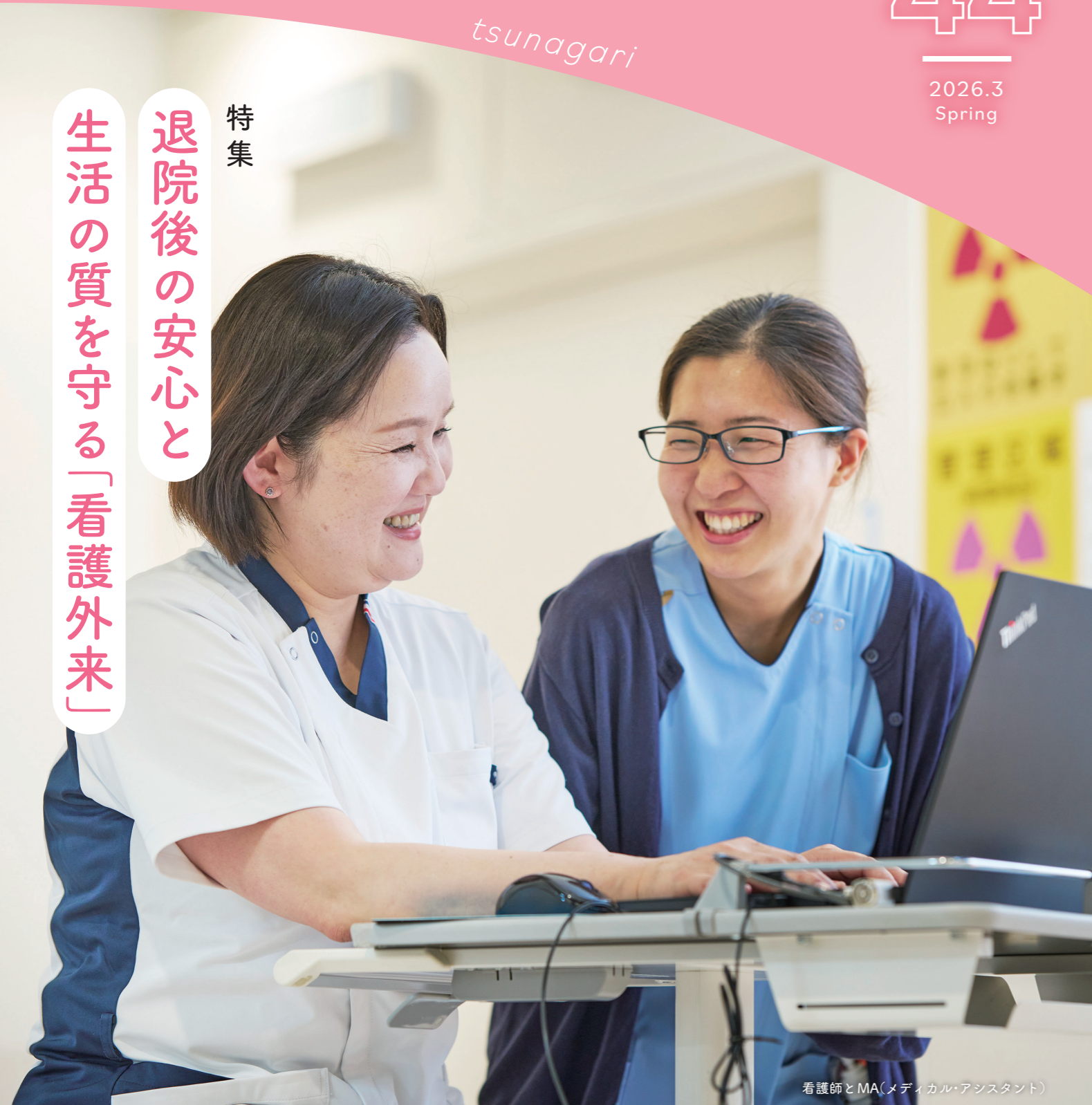
看護師とMA(メディカル・アシスタント)